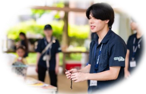
< 教育事業の補助の様子 >