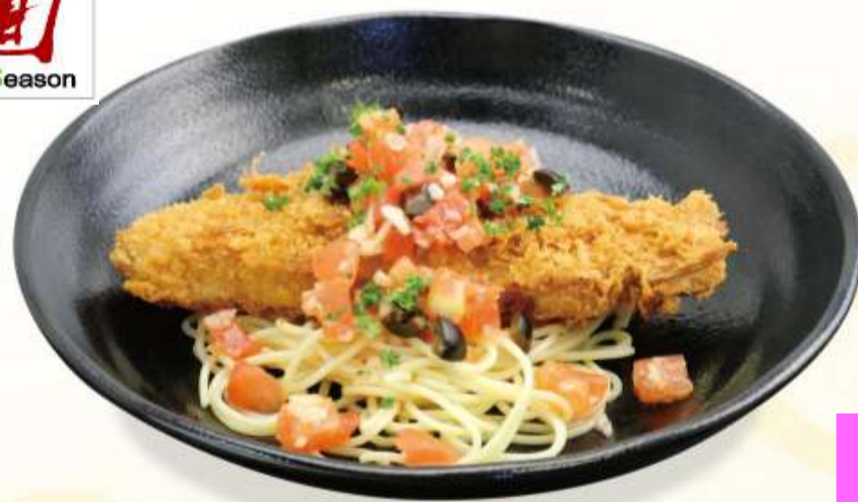
マグロのカツレツ フレッシュトマトソース